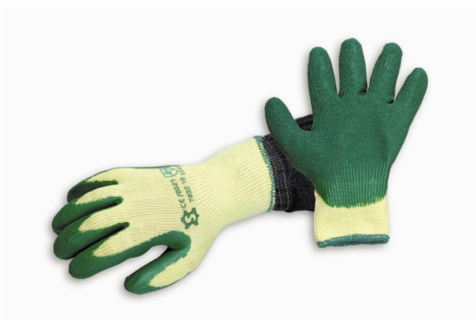
Tabla de medidas (longitud): Talla 8: ± 24 cm Talla 9: ± 25 cm Talla 10: ± 26 cm

Tallas: 8 (pequeña), 9 (mediana), 10 (grande)